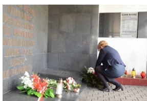
77. rocznica rozstrzelania 40 Polaków w Krakowie.