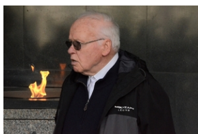
77. rocznica rozstrzelania 40 Polaków w Krakowie.