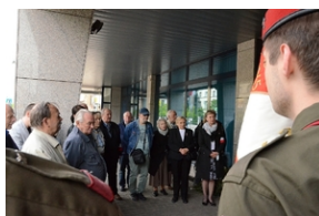
77. rocznica rozstrzelania 40 Polaków w Krakowie.