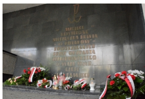
77. rocznica rozstrzelania 40 Polaków w Krakowie.