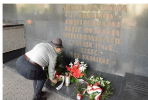
77. rocznica rozstrzelania 40 Polaków w Krakowie.