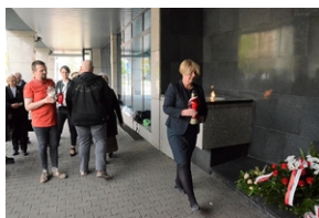
77. rocznica rozstrzelania 40 Polaków w Krakowie.