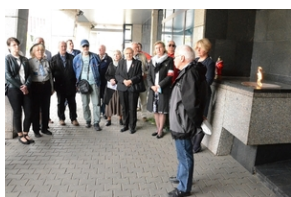
77. rocznica rozstrzelania 40 Polaków w Krakowie.