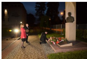
Oświęcim, 25 maja 2021, godz. 21.30.