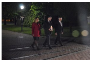
Oświęcim, 25 maja 2021, godz. 21.30.