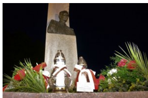
Oświęcim, 25 maja 2021, godz. 21.30.