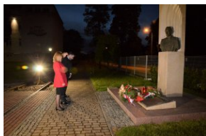
Oświęcim, 25 maja 2021, godz. 21.30.