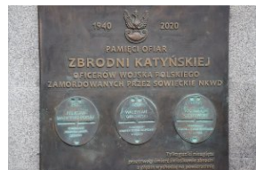
13.04.2021 w Krakowie oddano hołd ofiarom zbrodni katyńskiej.

Pod Krzyżem Katyńskim obecni byli m.in. przedstawiciele władz wojewódzkich i delegacja Stowarzyszenia Rodzina Ofiar Katynia Polski Południowej w Krakowie z prezesem