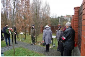
Wieliczka, 13.04.2021. Uroczystości katyńskie.