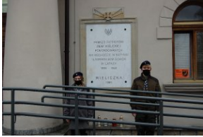
Wieliczka, 13.04.2021. Uroczystości katyńskie.