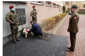
13.04.2021 w Krakowie oddano hołd ofiarom zbrodni katyńskiej.