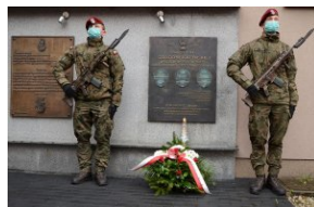
13.04.2021 w Krakowie oddano hołd ofiarom zbrodni katyńskiej.