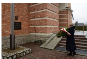
Skomielna Biała, 13.04.2021.