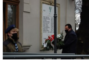
Wieliczka, 13.04.2021. Uroczystości katyńskie.