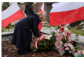
Nowy Targ, 13.04.2021. Uroczystości katyńskie.