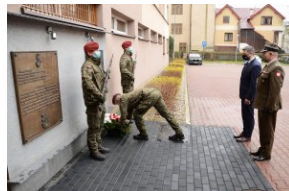
13.04.2021 w Krakowie oddano hołd ofiarom zbrodni katyńskiej.