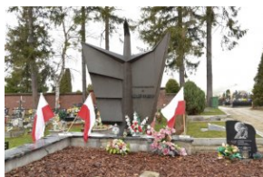
Nowy Targ, 13.04.2021. Uroczystości katyńskie.