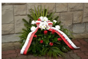
Skomielna Biała, 13.04.2021.