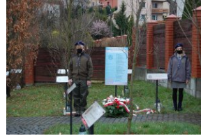
Wieliczka, 13.04.2021. Uroczystości katyńskie.