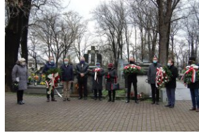
Wieliczka, 13.04.2021. Uroczystości katyńskie.