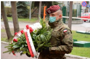
13.04.2021 w Krakowie oddano hołd ofiarom zbrodni katyńskiej.