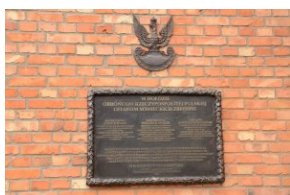
Skomielna Biała, 13.04.2021.