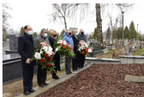
Nowy Targ, 13.04.2021. Uroczystości katyńskie.