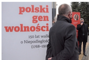
17.03.2021, Michałowice. Otwarcie wystawy „Polski gen wolności. 150 lat walk o Niepodległość”.