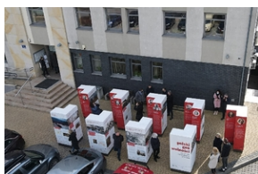
17.03.2021, Michałowice. Otwarcie wystawy „Polski gen wolności. 150 lat walk o Niepodległość”.