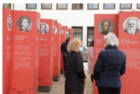
17.03.2021, Michałowice. Otwarcie wystawy „Polski gen wolności. 150 lat walk o Niepodległość”.