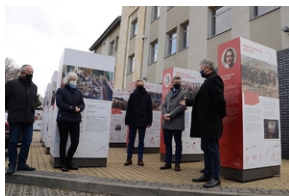
17.03.2021, Michałowice. Otwarcie wystawy „Polski gen wolności. 150 lat walk o Niepodległość”.