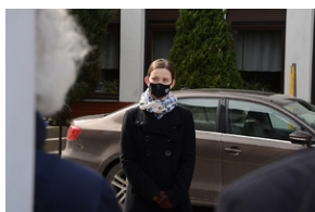
17.03.2021, Michałowice. Otwarcie wystawy „Polski gen wolności. 150 lat walk o Niepodległość”.