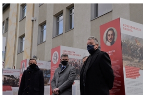
17.03.2021, Michałowice. Otwarcie wystawy „Polski gen wolności. 150 lat walk o Niepodległość”.