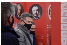
17.03.2021, Michałowice. Otwarcie wystawy „Polski gen wolności. 150 lat walk o Niepodległość”.