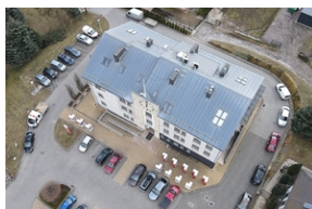
17.03.2021, Michałowice. Otwarcie wystawy „Polski gen wolności. 150 lat walk o Niepodległość”.