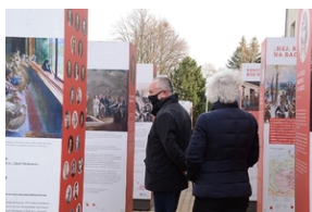
17.03.2021, Michałowice. Otwarcie wystawy „Polski gen wolności. 150 lat walk o Niepodległość”.