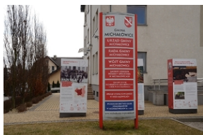
17.03.2021, Michałowice. Otwarcie wystawy „Polski gen wolności. 150 lat walk o Niepodległość”.