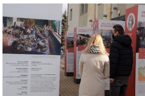
17.03.2021, Michałowice. Otwarcie wystawy „Polski gen wolności. 150 lat walk o Niepodległość”.