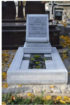
Krakowski IPN odnowił grób Wacława Żmudzińskiego w Nowym Targu