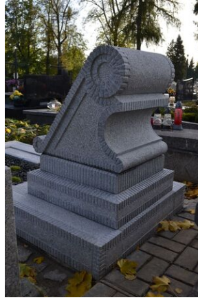
Krakowski IPN odnowił grób Wacława Żmudzińskiego w Nowym Targu