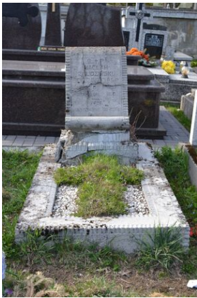
Krakowski IPN odnowił grób Wacława Żmudzińskiego w Nowym Targu