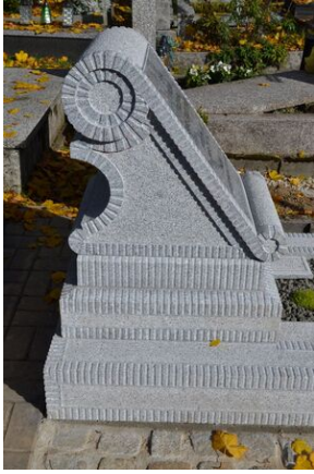
Krakowski IPN odnowił grób Wacława Żmudzińskiego w Nowym Targu