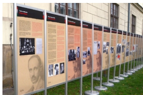
„Pál Teleki i Polska”. Wystawa w Krakowie.

Przechodząc ul. Rajską, warto zwolnić kroku, by zapoznać się z plenerową wystawą przed gmachem Wojewódzkiej Biblioteki Publicznej w Krakowie. Przedstawia ona hrabiego Pála Telekiego, dwukrotnego premiera Węgier (1920-1921 i 1939-1941), przyjaciela Polski, który pomagał nam w czasie wojny polsko-bolszewickiej, a także w obliczu niemieckiej agresji z 1939 r. Wystawa pozostanie na Rajskiej do 24 listopada 2020 r. Przygotowały ją Węgierskie Archiwum Narodowe i Archiwum w Segedynie, a w Polsce udostępnia krakowski IPN. 4 listopada na terenie biblioteki stanął pomnik Pála Telekiego.