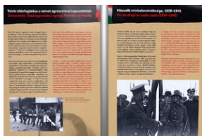
„Pál Teleki i Polska”. Wystawa w Krakowie.