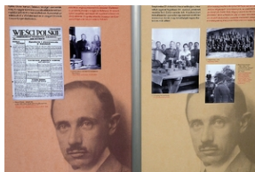
„Pál Teleki i Polska”. Wystawa w Krakowie.