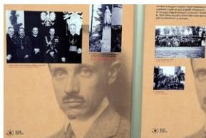
„Pál Teleki i Polska”. Wystawa w Krakowie.