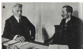
Ignacy Daszyński i Wincenty Witos

75. rocznica śmierci Wincentego Witosa, 84. rocznica śmierci Ignacego Daszyńskiego.