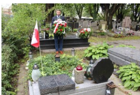
Uroczystości w 75. rocznicę powstania Zrzeszenia „WiN”