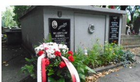
Uroczystości w 75. rocznicę powstania Zrzeszenia „WiN”