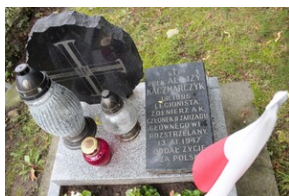
Uroczystości w 75. rocznicę powstania Zrzeszenia „WiN”