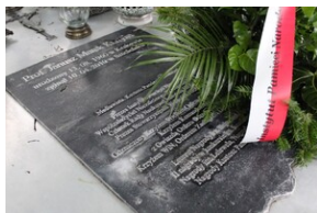
Uroczystości w 75. rocznicę powstania Zrzeszenia „WiN” - fot. Zaneta Wierzgacz