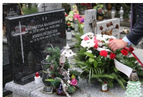
Uroczystości w 75. rocznicę powstania Zrzeszenia „WiN”