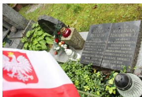
Uroczystości w 75. rocznicę powstania Zrzeszenia „WiN”