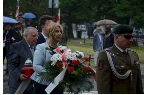
11.07.2020. W Krakowie uczczono 76. rocznicę akcji specjalnej Koppé.