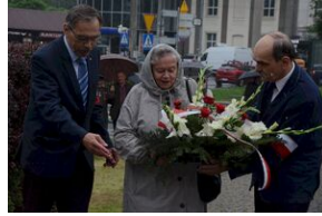
11.07.2020. W Krakowie uczczono 76. rocznicę akcji specjalnej Koppé.