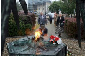
11.07.2020. W Krakowie uczczono 76. rocznicę akcji specjalnej Koppé.