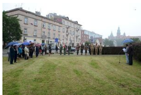
11.07.2020. W Krakowie uczczono 76. rocznicę akcji specjalnej Koppe.

Od lat w rocznicę akcji spotykają się przedstawiciele środowisk kombatanckich oraz harcerze, by uczcić pamięć bohaterskich żołnierzy batalionu „Parasol” i Okręgu Kraków AK. W uroczystościach uczestniczą także żołnierze Wojska Polskiego, szczególnie Jednostki Wojskowej Komandosów z Lublińca, dziedziczącej tradycje batalionu „Parasol” i Jednostki Wojskowej „NIL”.