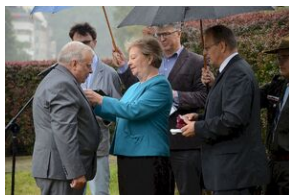
11.07.2020. W Krakowie uczczono 76. rocznicę akcji specjalnej Koppe.