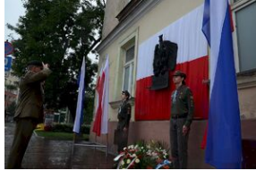
11.07.2020. W Krakowie uczczono 76. rocznicę akcji specjalnej Koppé.