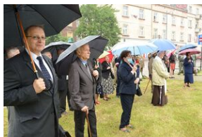
11.07.2020. W Krakowie uczczono 76. rocznicę akcji specjalnej Koppe.