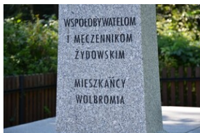
Upamiętnienie ofiar niemieckiej zbrodni w Wolbromiu.