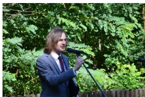
Upamiętnienie ofiar niemieckiej zbrodni w Wolbromiu.