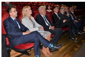
Upamiętnienie ofiar niemieckiej zbrodni w Wolbromiu.