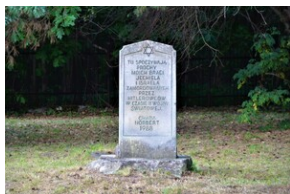
Upamiętnienie ofiar niemieckiej zbrodni w Wolbromiu.