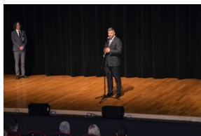
Upamiętnienie ofiar niemieckiej zbrodni w Wolbromiu.