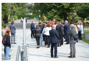
Upamiętnienie ofiar niemieckiej zbrodni w Wolbromiu.