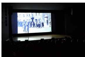
Upamiętnienie ofiar niemieckiej zbrodni w Wolbromiu.