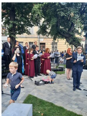
W Nowym Sączu otwarto Skwer Pamięci Ofiar Zagłady.