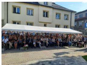
W Nowym Sączu otwarto Skwer Pamięci Ofiar Zagłady.