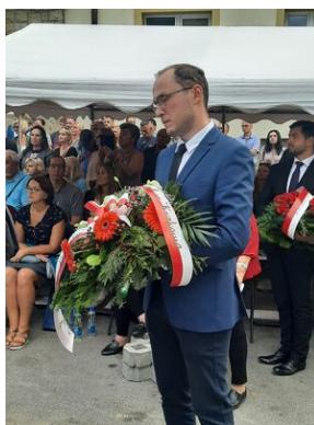
W Nowym Sączu otwarto Skwer Pamięci Ofiar Zagłady.