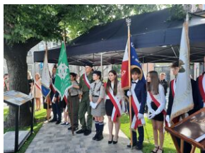
W Nowym Sączu otwarto Skwer Pamięci Ofiar Zagłady.