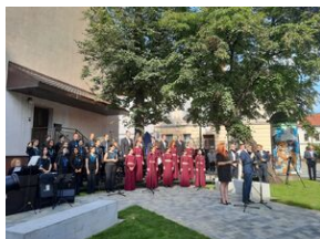
W Nowym Sączu otwarto Skwer Pamięci Ofiar Zagłady.