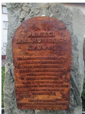
Uroczystość pamięci limanowskich Żydów.