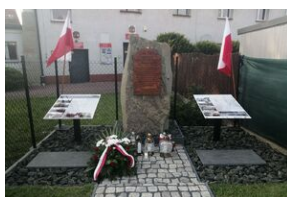
Uroczystość pamięci limanowskich Żydów.