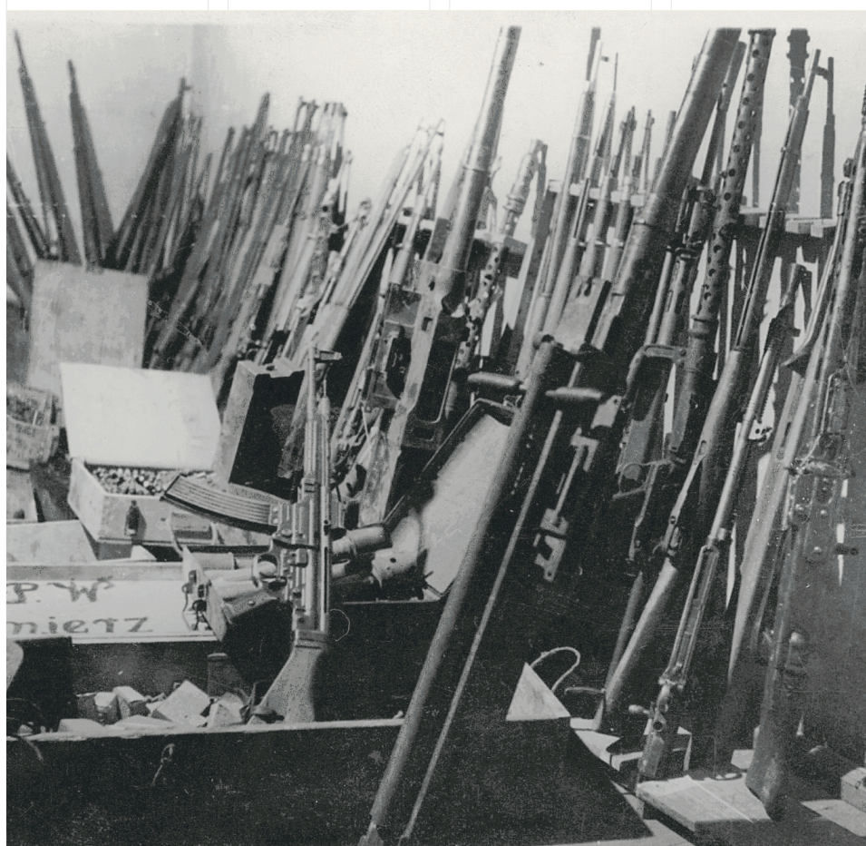
Zdjęcie pozyskanej broni wykonane przez UB.