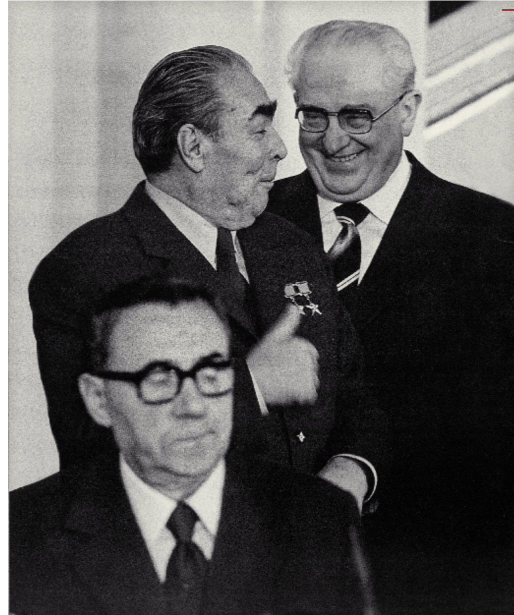
Przewódca Związku Sowieckiego Leonid Breżniew w rozmowie z przewodniczącym KGB Jurijem Andropowem. Poniżej minister spraw zagranicznych Andriej Gromyko. Ta trójka miała największy wpływ na sowiecką politykę wobec Jana Pawła II