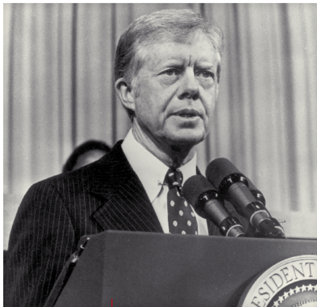
Administracja prezydenta USA Jimmy'ego Cartera, która promowała prawa człowieka, spodziewała się, że pontyfikat Jana Pawła II będzie akcentował także te problemy

Amerykanie szczególnie dużo miejsca w depeszach poświęcali sytuacji w Krakowie. Jego mieszkańcy z ciekawością, ale i podejrz-