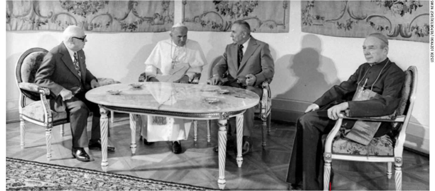
2 czerwca 1979 r. Edward Gierek przyjmuje Jana Pawła II w Belwedrze. Towarzyszą im kard. Stefan Wyszyński, prymas Polski, i prof. Henryk Jabłoński, przewodniczący Rady Państwa

Z satisfakcją odnotowano, że wystosowanie depeszy do papieża zostało bardzo dobrze przyjęte w społeczeństwie. Podobnie zresztą jak fakt wyjazdu na inaugurację pontyfikatu do Rzymu wysokiej rangi delegacji rządowej pod przewodnictwem formalnej głowy państwa, czyli Henryka Jabłońskiego. Jego obecność miała rzekomo „unaoczniać jedność narodu polskiego”. Do wyjazdu oraz rozmowy przewodniczącego Rady Państwa z papieżem starannie się przygotowano. Opracowano specjalny dokument, w którym przedstawiono propozycje tematyczne do rozmowy z papieżem (w wariantcie audiencji krótkiej i dłuższej), a także prawdopodobne tematy szczegółowe, które mógł poruszyć Jan Paweł II. Spodziewano się na przykład, że poza pięcioma zasadniczymi problemami polityki wyznaniowej (jak budownictwo sakralne czy dostęp Kościoła do środków masowego przekazu) papież będzie interweniował w konkretnych przypadkach, jak np. lokalizacji budowy kościoła w Oświęcimiu czy zwiększenia