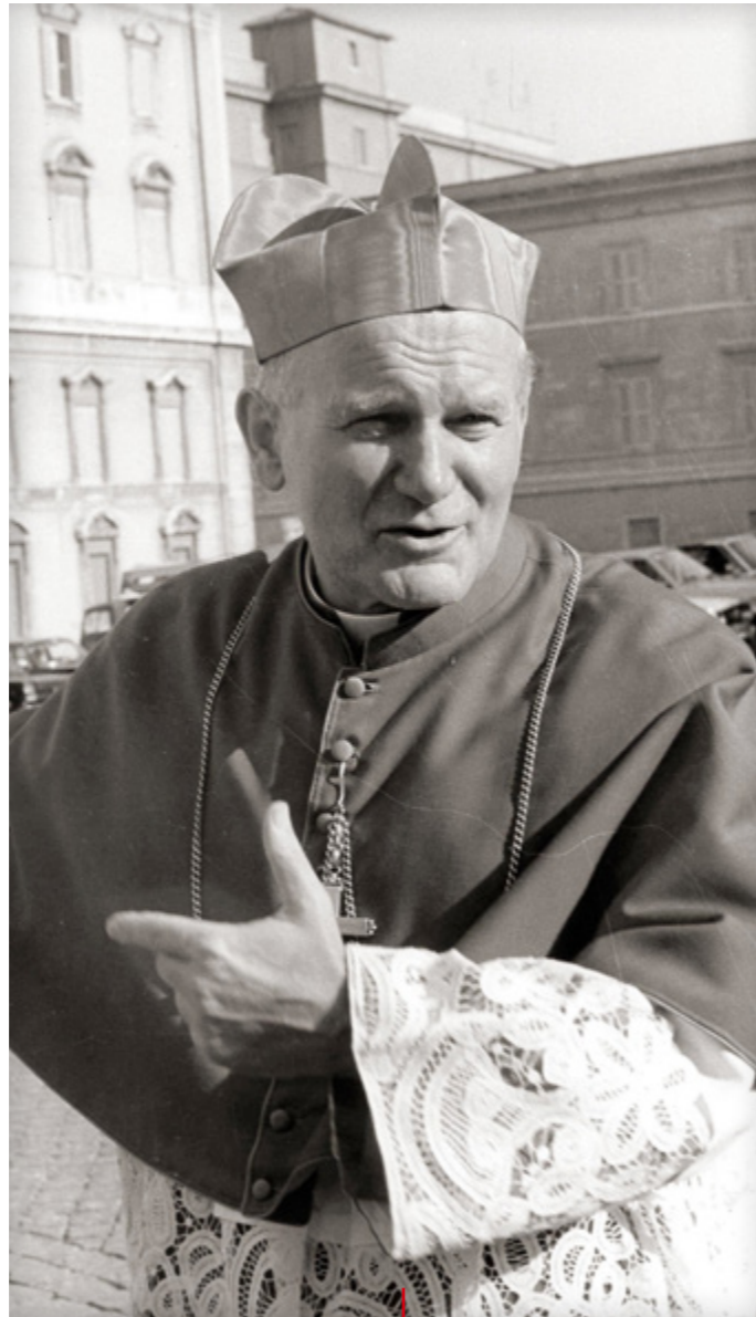
Kardynał Karol Wojtyła w Watykanie podczas sierpniowego konklawe, które wybrało Jana Pawła I

„Dwa systemy totalitarne, a więc z jednej strony groza wojny, obozów koncentracyjnych nazizmu, z drugiej zaś ucisk i terror komunistyczny, które tak bardzo zaciążyły nad naszym nieuleciami, dane mi było poznać stuleciem od wewnątrz” – pisał w Darze i Tajemnicy 5 . Także to doświadczenie, do dziś nie przemyślane w sposób głębszy i systematyczny w świecie zachodnim, a poza nim prawie nieznanne, podniósł papież z Polski do poziomu uniwersalnego. Doty-