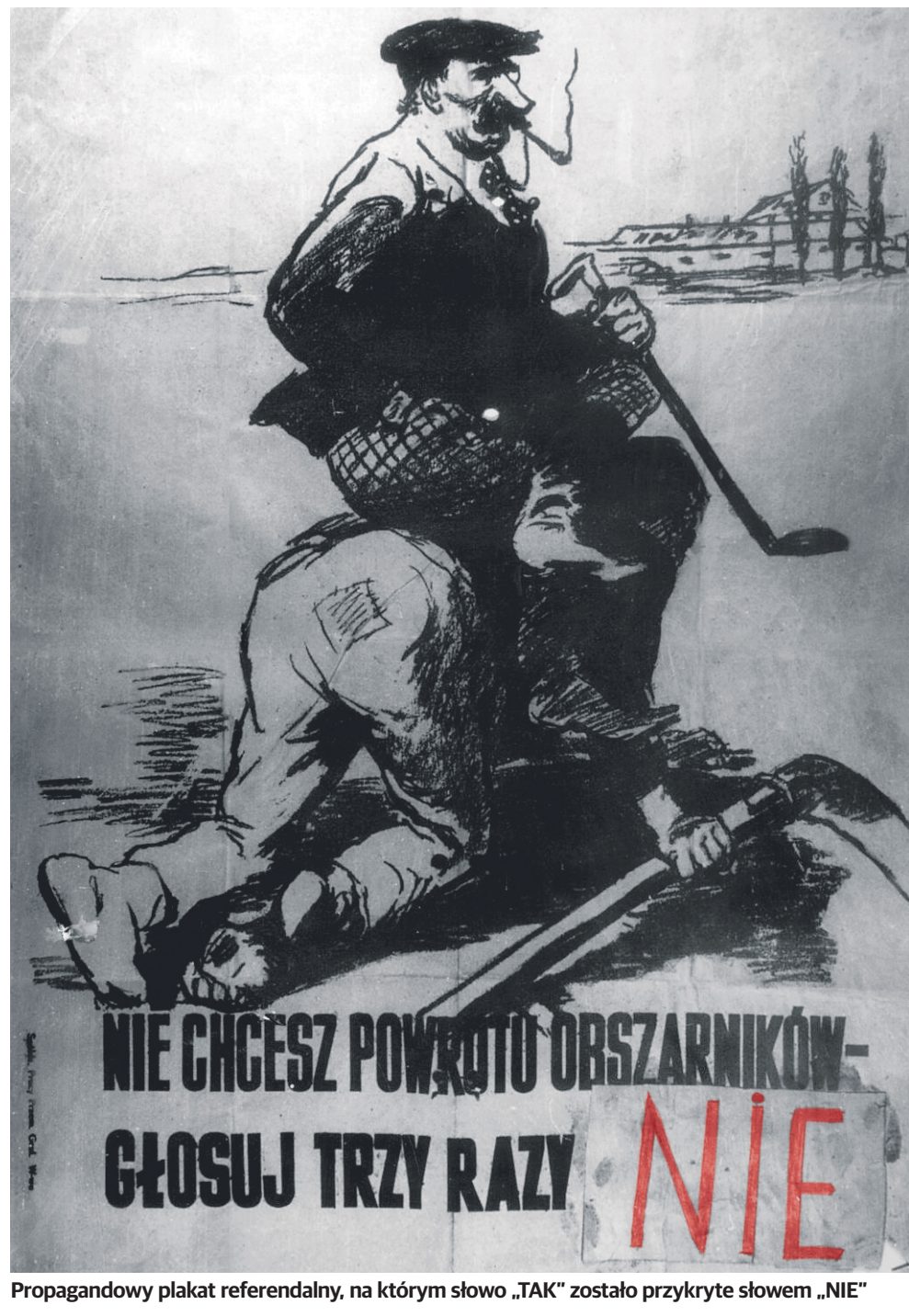
Propagandowy plakat referendalny, na którym słowo „TAK” zostało przykryte słowem „NIE”

Drugim wicepremierem był Stanisław Mikołajczyk, lider Polskiego Stronnictwa Ludowego, były premier Rządu RP na Uchodźstwie. Gdy na konferencji jałtańskiej zapisywano, że TRJN powstanie na bazie komunistycznego Rządu Tymczasowego z dołączeniem demokratycznych polityków z kraju i z zagranicy, to myślnie właśnie o ludowcach i Mikołajczyku. Ten polityk już w listopadzie 1944 r. przestał być premierem uchodźczego rządu uznając, że losy państwa rozstrzygną w kraju. Wrócił do Polski w czerwcu 1945 r. i stanął na czele wychodzącego z konspiracji SL - formalnie prezesem był do śmierci Wincenty Witos, ale realnie kierował Mikołajczyk. Pod jego sztandar przeszła również część „lubelskiego” SL. Żeby odróżnić się od prokomunistycznych ludowców, do nazwy SL dodano przymiotnik „Polskie”, stąd od sierpnia 1945 r. mowa o PSL. Oprócz