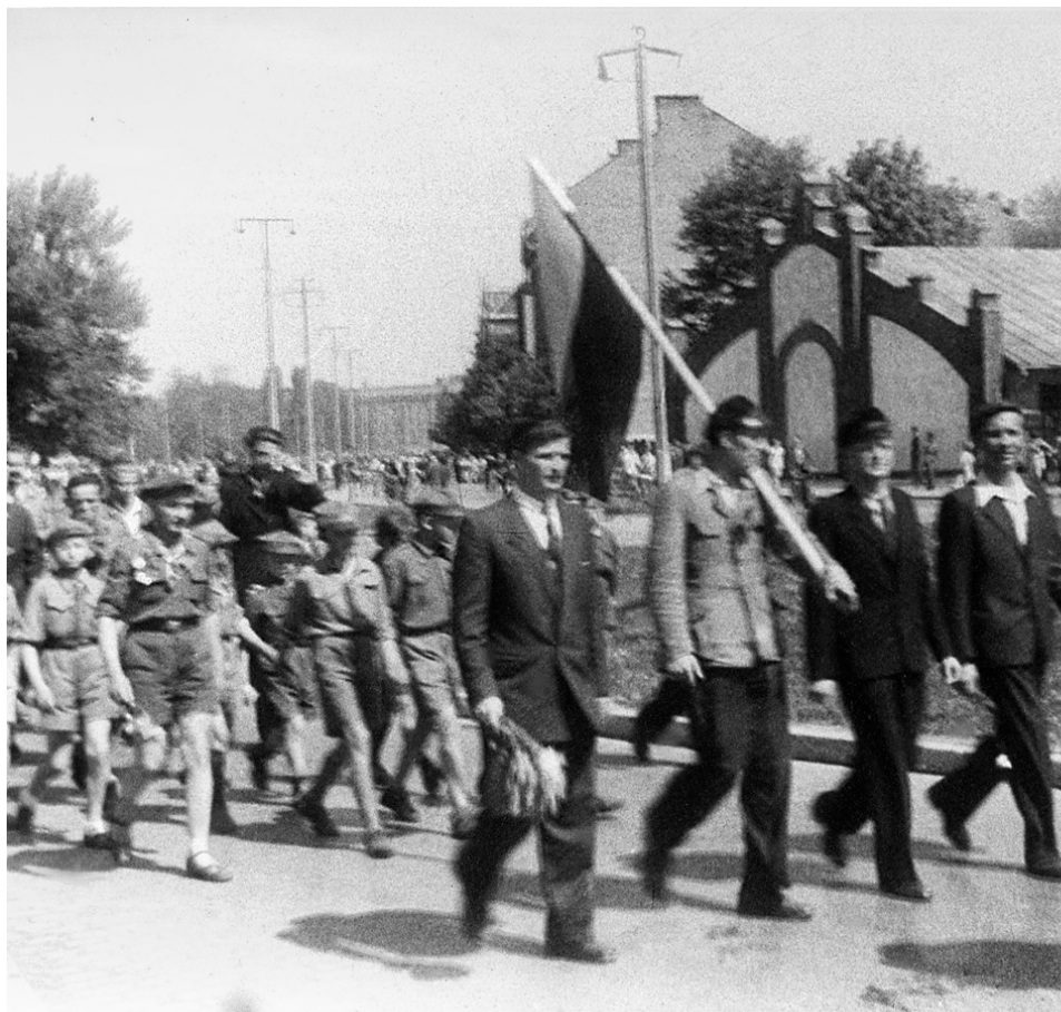
Manifestacja 3 maja 1946 r. na krakowskich alejach

Zakaz urządzania pochodów i manifestacji został wydany w ostatniej chwili wieczorem 2 maja. Stwierdzenie „ostatnia chwila” należy rozumieć dosłownie, do niektórych powiatów informacja doszła dopiero 3 maja nad ranem. Tak było np. w Chrzanowie, gdzie telefonogram dotarł 3 maja o godz. 3.45. Zezwolono jedynie na okazjonalne msze święte w kościołach i spotkania w budynkach. Zakaz nie został publicznie ogłoszony i nie był możliwy do wykonania.