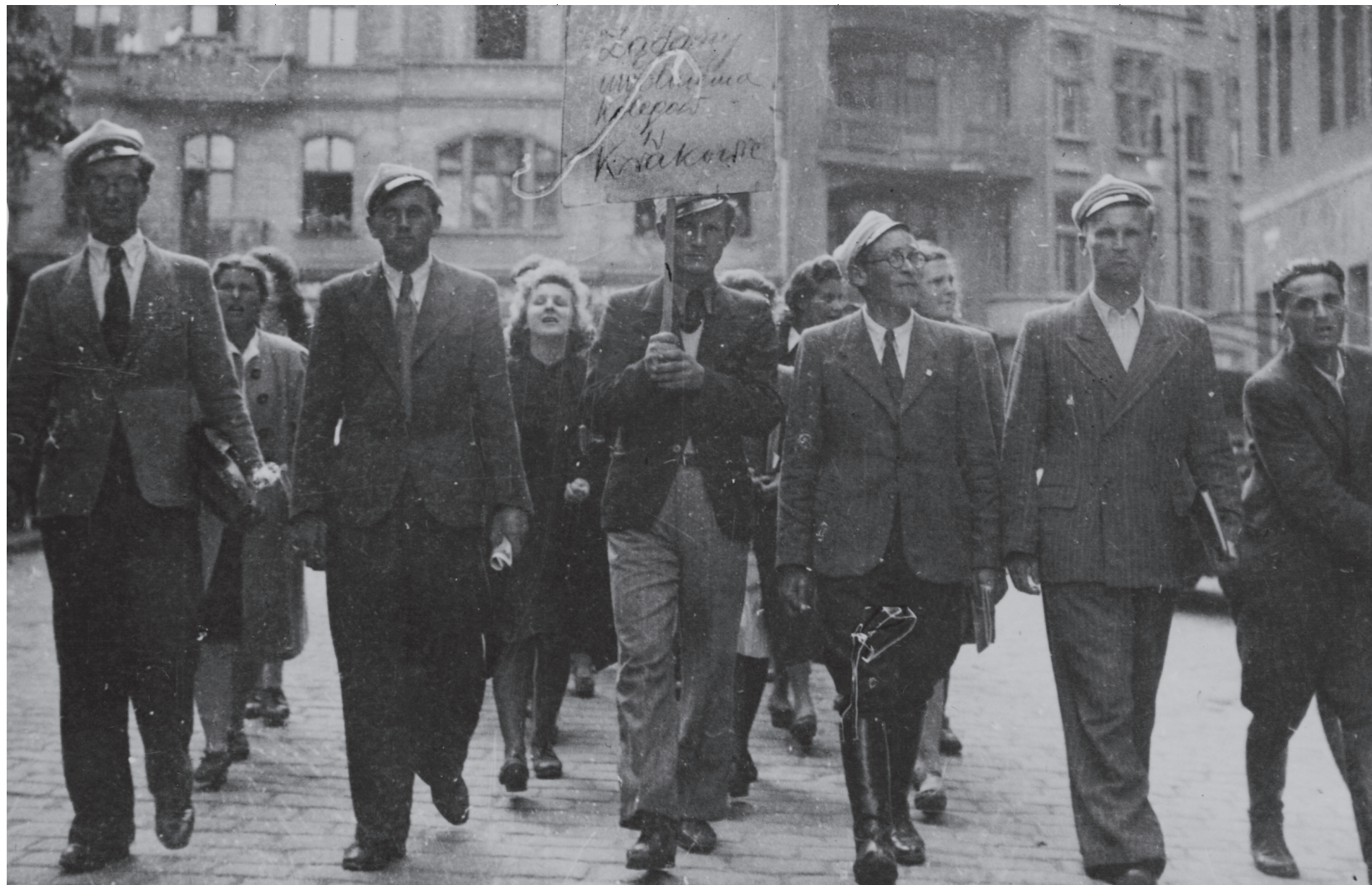
Poznańscy studenci demonstrują w maju 1946 r. z hasłem „Żądamy uwolnienia kolegów w Krakowie”

Aparatem represji kierowało Ministerstwo Bezpieczeństwa Publicznego, któremu podlegał m.in. Urząd Bezpieczeństwa, Korpus Bezpieczeństwa Wewnętrznego (KBW), Milicja Obywatelska (MO) czy powołana w lutym 1946 r. Ochotnicza Rezerwa Milicji Obywatelskiej (ORMO). Walka z podziemiem to zbrojne oblavy UB, KBW, MO, a często i wojska w terenie, to wymuszanie zeznań przez okrutne tortury, to próby wprowadzania agentów do konspiracyjnych struktur. To nieradko skrytobójcze mordy, również działaczy PSL. Po brutalnych