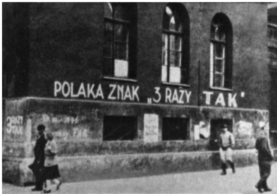
Komunistyczna propaganda przed referendum

Największa partia opozycyjna – Polskie Stronnictwo Ludowe – znalazła się w trudnym położeniu. Program PSL nakazy-