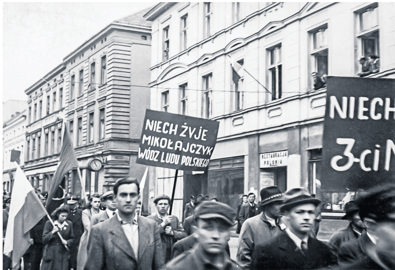
Niech żyje Mikołajczyk! Niech żyje 3 Maj! - hasła jednego z pochodów trzecomajowych 1946 r. w Polsce

Podział zaczynał się jednak rysować coraz wyraźniej. W lutym 1946 r. Józef Stalin w jednym ze swych wystąpień mówił o izolacji wobec Zachodu. Niespełna miesiąc później Winston Churchill w czasie przemówienia w Fulton z początku marca wygłosił słynne zdanie: „Od Sycyzyna nad Bałtykiem do Triestu nad Morzem Adriatyckim zapadła żelazna kurtyna dzieląc nasz kontynent. Poza tą linią pozostały stolice tego, co dawniej było Europą Środkową i Wschodnią. Warszawa, Berlin, Praga, Wiedeń,