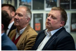
Krakowska premiera filmu dokumentalnego „Rakowiecka 37”.