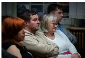
Krakowska premiera filmu dokumentalnego „Rakowiecka 37”.