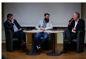
Krakowska premiera filmu dokumentalnego „Rakowiecka 37”.