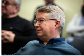
Krakowska premiera filmu dokumentalnego „Rakowiecka 37”.

W dawnej komunistycznej katowni, w której w czasach stalinowskich torturowano i mordowano największych polskich patriotów, a potem więziono działaczy opozycji politycznej w PRL, mieści się obecnie Muzeum Żołnierzy Wyklętych i Więźniów Politycznych PRL. Od marca 2022 r. organem prowadzącym tę placówkę jest Instytut Pamięci Narodowej, a samo muzeum nadal pozostaje w fazie organizacji. Sercem projektu są pawilony więzienne – X, w którym więziono bohaterów walk o niepodległość z lat 1945-1956 oraz XII, w którym przetrzymywano opozycjonistów z lat 70. i 80.