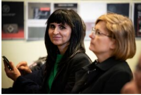
Krakowska premiera filmu dokumentalnego „Rakowiecka 37”.