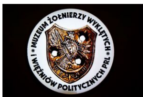
Krakowska premiera filmu dokumentalnego „Rakowiecka 37”.