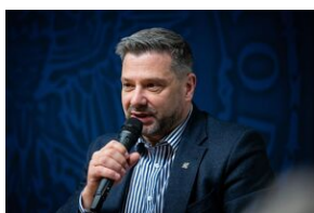
Krakowska premiera filmu dokumentalnego „Rakowiecka 37”.