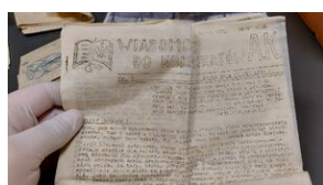
Odnalezione w Olkuszu archiwum 116 pp AK.