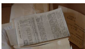
Odnalezione w Olkuszu archiwum 116 pp AK.