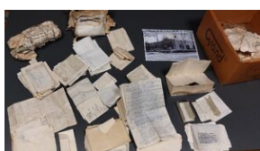
Odnalezione w Olkuszu archiwum 116 pp AK.