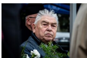
Uroczystości w Miechowie i Siedliskach.