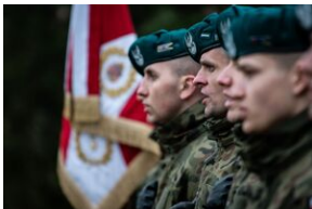
Uroczystości w Miechowie i Siedliskach.