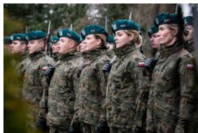
Uroczystości w Miechowie i Siedliskach.