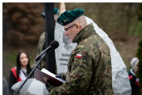
Uroczystości w Miechowie i Siedliskach.