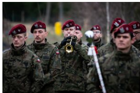
Uroczystości w Miechowie i Siedliskach.