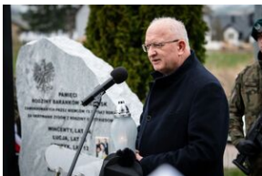
Uroczystości w Miechowie i Siedliskach.