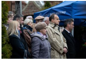
Uroczystości w Miechowie i Siedliskach.