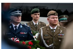
Uroczystości w Miechowie i Siedliskach.