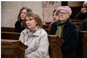
Uroczystości w Miechowie i Siedliskach.