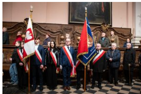
Uroczystości w Miechowie i Siedliskach.