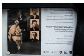
Uroczystości w Miechowie i Siedliskach.