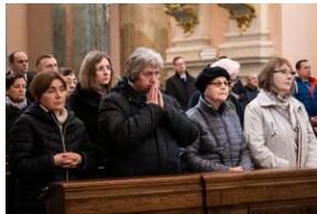
Uroczystości w Miechowie i Siedliskach.