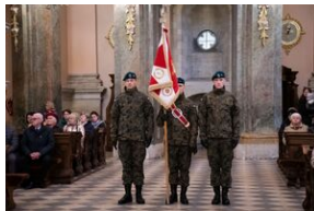
Uroczystości w Miechowie i Siedliskach.