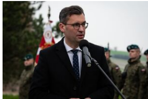
Uroczystości w Miechowie i Siedliskach.