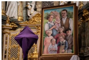
Uroczystości w Miechowie i Siedliskach.