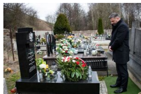
Groby Kucharskich i Książków w Kozłowie.