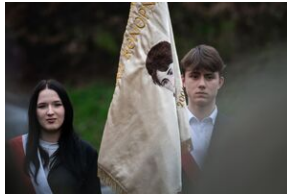
Uroczystości w Miechowie i Siedliskach.