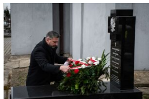
Groby Kucharskich i Książków w Kozłowie.

W 2012 r. rodzina Baranków została uhonorowana tytułem Sprawiedliwych wśród Narodów Świata. W marcu 2022 r. w Siedliskach odsłonięto pomnik Baranków, ufundowany przez Instytut Pamięci Narodowej.