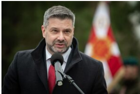
Uroczystości w Miechowie i Siedliskach.