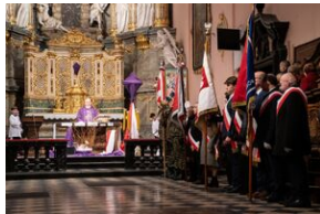
Uroczystości w Miechowie i Siedliskach.