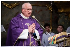
Uroczystości w Miechowie i Siedliskach.