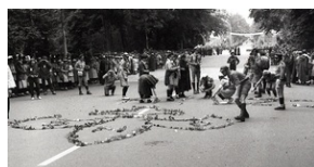
Lilijka z kwiatów