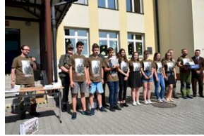
X Rajd Szlakami Żołnierzy 1. Pułku Strzelców Podhalańskich AK