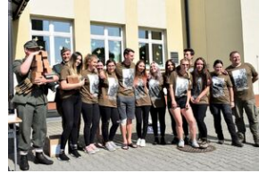
X Rajd Szlakami Żołnierzy 1. Pułku Strzelców Podhalańskich AK