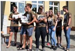
X Rajd Szlakami Żołnierzy 1. Pułku Strzelców Podhalańskich AK