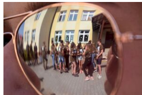
X Rajd Szlakami Żołnierzy 1. Pułku Strzelców Podhalańskich AK