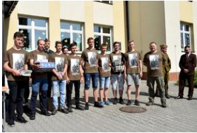
X Rajd Szlakami Żołnierzy 1. Pułku Strzelców Podhalańskich AK