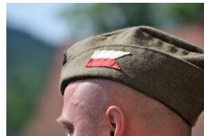
X Rajd Szlakami Żołnierzy 1. Pułku Strzelców Podhalańskich AK