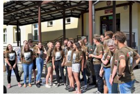
X Rajd Szlakami Żołnierzy 1. Pułku Strzelców Podhalańskich AK