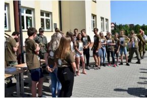
X Rajd Szlakami Żołnierzy 1. Pułku Strzelców Podhalańskich AK