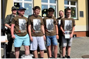
X Rajd Szlakami Żołnierzy 1. Pułku Strzelców Podhalańskich AK