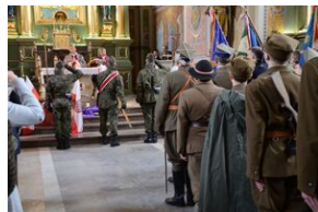
24 marca 2019 r. w Osielcu odsłonięto pomnik mjr. Zygmunta Szendzielarza „Łupaszki”