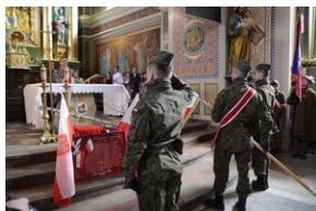
24 marca 2019 r. w Osielcu odsłonięto pomnik mjr. Zygmunta Szendzielarza „Łupaszki”