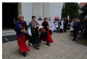
24 marca 2019 r. w Osielcu odsłonięto pomnik mjr. Zygmunta Szendzielarza „Łupaszki”