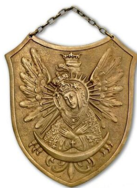
Ryngraf z Matką Boską Ostrobramską, używany przez wielu żołnierzy AK na Wileńszczyźnie