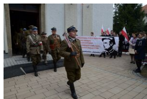
24 marca 2019 r. w Osielcu odsłonięto pomnik mjr. Zygmunta Szendzielarza „Łupaszki”