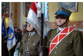
24 marca 2019 r. w Osielcu odsłonięto pomnik mjr. Zygmunta Szendzielarza „Łupaszki”