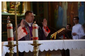
24 marca 2019 r. w Osielcu odsłonięto pomnik mjr. Zygmunta Szendzielarza „Łupaszki”