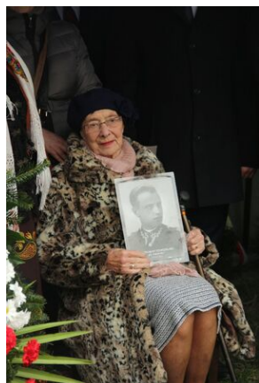
24 marca 2019 r. w Osielcu odsłonięto pomnik mjr. Zygmunta Szendzielarza „Łupaszki”