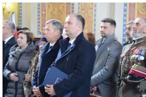
24 marca 2019 r. w Osielcu odsłonięto pomnik mjr. Zygmunta Szendzielarza „Łupaszki”