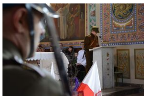
24 marca 2019 r. w Osielcu odsłonięto