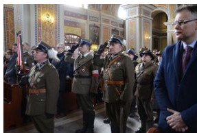
24 marca 2019 r. w Osielcu odsłonięto pomnik mjr. Zygmunta Szendzielarza „Łupaszki”