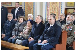
24 marca 2019 r. w Osielcu odsłonięto pomnik mjr. Zygmunta Szendzielarza „Łupaszki”