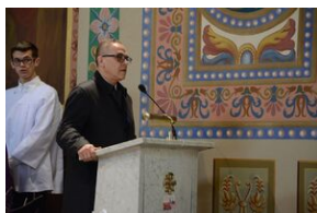
24 marca 2019 r. w Osielcu odsłonięto