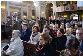
24 marca 2019 r. w Osielcu odsłonięto pomnik mjr. Zygmunta Szendzielarza „Łupaszki”