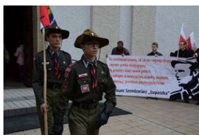
24 marca 2019 r. w Osielcu odsłonięto pomnik mjr. Zygmunta Szendzielarza „Łupaszki”