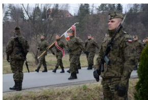
24 marca 2019 r. w Osielcu odsłonięto pomnik mjr. Zygmunta Szendzielarza „Łupaszki”