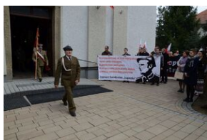
24 marca 2019 r. w Osielcu odsłonięto pomnik mjr. Zygmunta Szendzielarza „Łupaszki”