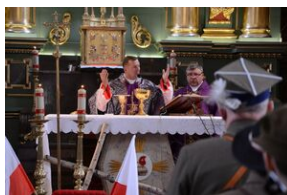
24 marca 2019 r. w Osielcu odsłonięto