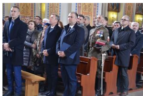
24 marca 2019 r. w Osielcu odsłonięto pomnik mjr. Zygmunta Szendzielarza „Łupaszki”