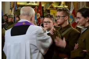
24 marca 2019 r. w Osielcu odsłonięto pomnik mjr. Zygmunta Szendzielarza „Łupaszki”