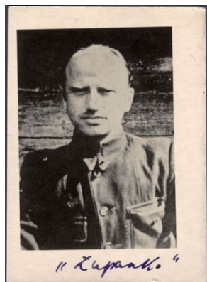
Zdjęcie majora z ogólnopolskiego listu gończego wydanego przez komunistyczny aparat bezpieczeństwa

Więcej informacji o majorze na portalu IPN: WILCZE TROPY