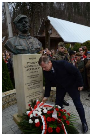
24 marca 2019 r. w Osielcu odsłonięto pomnik mjr. Zygmunta Szendzielarza „Łupaszki”