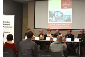
Przystanek Historia w Kielcach. Konferencja prasowa promująca II tom Serii Świętokrzyskiej