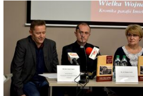
Przystanek Historia w Kielcach. Konferencja prasowa promująca II tom Serii Świętokrzyskiej