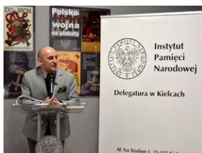
Przystanek Historia w Kielcach. Konferencja prasowa promująca II tom Serii