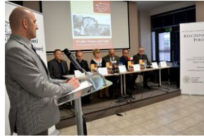
Przystanek Historia w Kielcach. Konferencja prasowa promująca II tom Serii Świętokrzyskiej