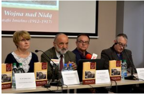
Przystanek Historia w Kielcach. Konferencja prasowa promująca II tom Serii Świętokrzyskiej