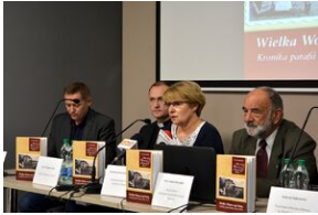
Przystanek Historia w Kielcach. Konferencja prasowa promująca II tom Serii Świętokrzyskiej