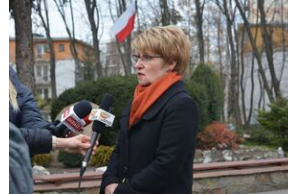
Dąb Niepodległości „Józef Piłsudski” zasadzony przed budynkiem VII LO w Kielcach