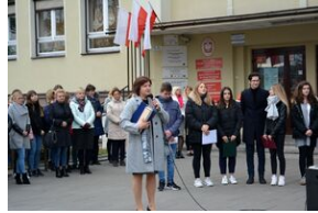
Dąb Niepodległości „Józef Piłsudski” zasadzony przed budynkiem VII LO w Kielcach