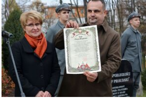
Dąb Niepodległości „Józef Piłsudski” zasadzony przed budynkiem VII LO w Kielcach