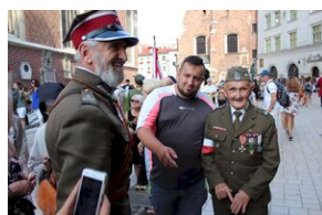
Krakowskie uroczystości w 74. rocznicę wybuchu powstania warszawskiego