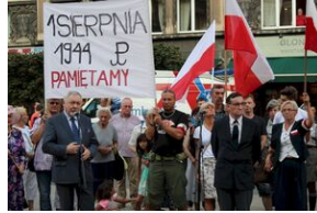
Krakowskie uroczystości w 74. rocznicę wybuchu powstania warszawskiego