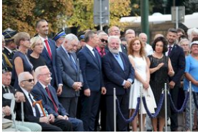
Krakowskie uroczystości w 74. rocznicę wybuchu powstania warszawskiego