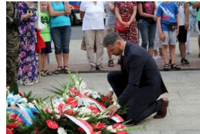
Krakowskie uroczystości w 74. rocznicę wybuchu powstania warszawskiego