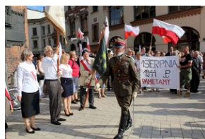
Krakowskie uroczystości w 74. rocznicę wybuchu powstania warszawskiego