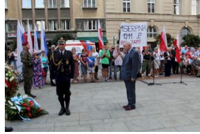
Krakowskie uroczystości w 74. rocznicę wybuchu powstania warszawskiego