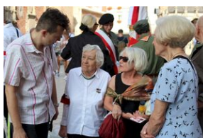
Krakowskie uroczystości w 74. rocznicę wybuchu powstania warszawskiego