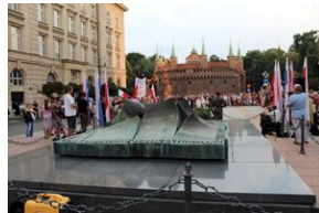
Krakowskie uroczystości w 74. rocznicę wybuchu powstania warszawskiego