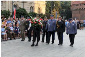
Krakowskie uroczystości w 74. rocznicę wybuchu powstania warszawskiego