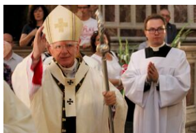
Krakowskie uroczystości w 74. rocznicę wybuchu powstania warszawskiego