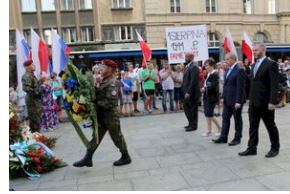
Krakowskie uroczystości w 74. rocznicę wybuchu powstania warszawskiego