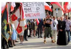
Krakowskie uroczystości w 74. rocznicę wybuchu powstania warszawskiego