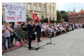
Krakowskie uroczystości w 74. rocznicę wybuchu powstania warszawskiego