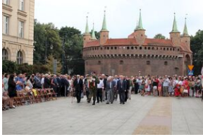
Krakowskie uroczystości w 74. rocznicę wybuchu powstania warszawskiego