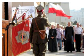
Krakowskie uroczystości w 74. rocznicę wybuchu powstania warszawskiego