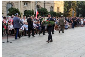
Krakowskie uroczystości w 74. rocznicę wybuchu powstania warszawskiego