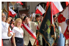
Krakowskie uroczystości w 74. rocznicę wybuchu powstania warszawskiego