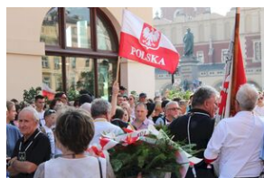
Krakowskie uroczystości w 74. rocznicę wybuchu powstania warszawskiego