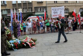
Krakowskie uroczystości w 74. rocznicę wybuchu powstania warszawskiego