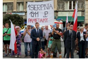
Krakowskie uroczystości w 74. rocznicę wybuchu powstania warszawskiego