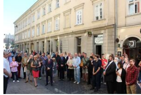
Spotkanie w 41. rocznicę śmierci Stanisława Pyjasa