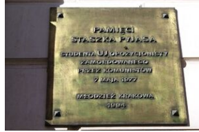
Tablica pamięci Stanisława Pyjasa przy ul. Szewskiej w Krakowie