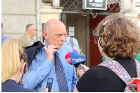
Spotkanie w 41. rocznicę śmierci Stanisława Pyjasa