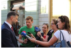
Spotkanie w 41. rocznicę śmierci Stanisława Pyjasa