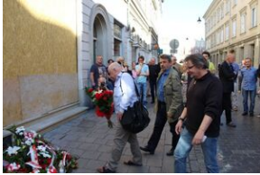
Spotkanie w 41. rocznicę śmierci Stanisława Pyjasa