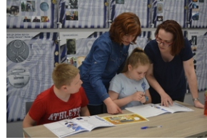
Warsztaty „Śledztwo katyńskie”. Przystanek Historia IPN w Kielcach