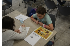
Warsztaty „Śledztwo katyńskie”. Przystanek Historia IPN w Kielcach