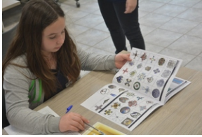
Warsztaty „Śledztwo katyńskie”. Przystanek Historia IPN w Kielcach