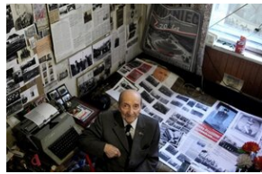
Śp. kpt. Zenon Malik w Kadeckiej Izbie Pamięci przy ul. Urzędniczej w Krakowie