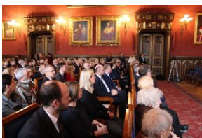
W Collegium Novum odsłonięto tablicę upamiętniającą tajne nauczanie na UJ