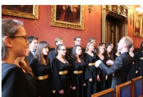
W Collegium Novum odsłonięto tablicę upamiętniającą tajne nauczanie na UJ