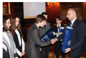
Nagrody dla zwycięzców gry miejskiej „Zakazana szkoła”