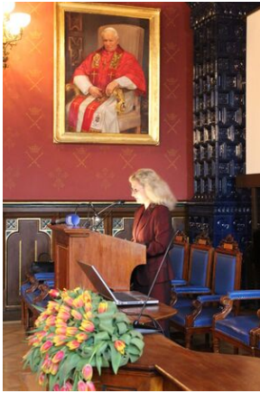
W Collegium Novum odsłonięto tablicę upamiętniającą tajne nauczanie na UJ