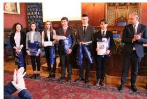
Nagrody dla zwycięzców gry miejskiej „Zakazana szkoła”