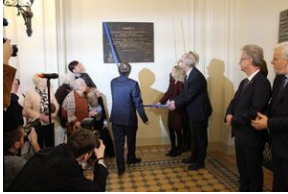
W Collegium Novum odsłonięto tablicę upamiętniającą tajne nauczanie na UJ