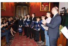
Nagrody dla zwycięzców gry miejskiej „Zakazana szkoła”