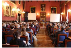
W Collegium Novum odsłonięto tablicę upamiętniającą tajne nauczanie na UJ