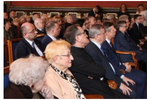
W Collegium Novum odsłonięto tablicę upamiętniającą tajne nauczanie na UJ