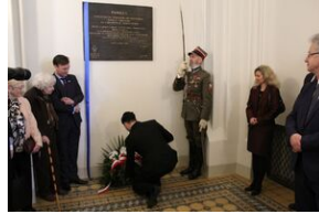
W Collegium Novum odsłonięto tablicę upamiętniającą tajne nauczanie na UJ