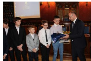
Nagrody dla zwycięzców gry miejskiej „Zakazana szkoła”