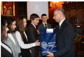
Nagrody dla zwycięzców gry miejskiej „Zakazana szkoła”