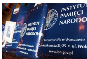
Nagrody dla zwycięzców gry miejskiej „Zakazana szkoła”