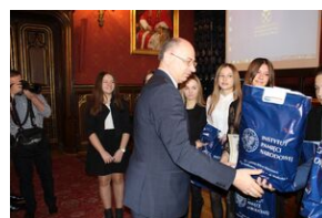
Nagrody dla zwycięzców gry miejskiej „Zakazana szkoła”