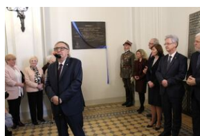
W Collegium Novum odsłonięto tablicę upamiętniającą tajne nauczanie na UJ