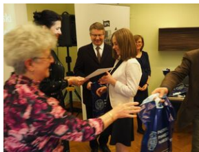
Konkurs recytatorski „W kręgu poezji i prozy łagrowej więźniarek KL Ravensbrück”. Eliminacje wojewódzkie w Krakowie