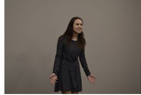
Konkurs recytatorski „W kręgu poezji i prozy lagrowej więźniarek KL Ravensbrück”. Eliminacje wojewódzkie w Kielcach