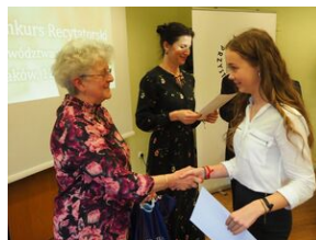
Konkurs recytatorski „W kręgu poezji i prozy lagrowej więźniarek KL Ravensbrück”. Eliminacje wojewódzkie