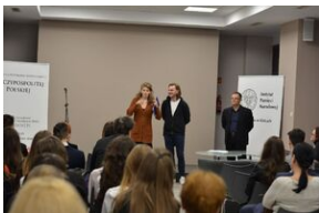
Konkurs recytatorski „W kręgu poezji i prozy lagrowej więźniarek KL Ravensbrück”. Eliminacje wojewódzkie w Kielcach