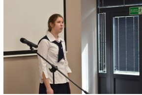
Konkurs recytatorski „W kręgu poezji i prozy lagrowej więźniarek KL Ravensbrück”. Eliminacje wojewódzkie w Kielcach