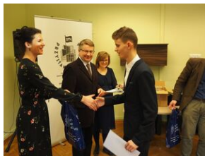
Konkurs recytatorski „W kręgu poezji i prozy łagrowej więźniarek KL Ravensbrück”. Eliminacje wojewódzkie w Krakowie