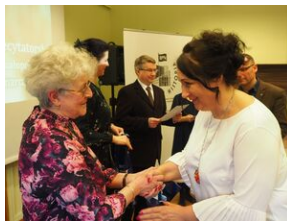
Konkurs recytatorski „W kręgu poezji i prozy łagrowej więźniarek KL Ravensbrück”. Eliminacje wojewódzkie w Krakowie