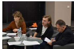
Konkurs recytatorski „W kręgu poezji i prozy lagrowej więźniarek KL Ravensbrück”. Eliminacje wojewódzkie w Kielcach