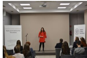
Konkurs recytatorski „W kręgu poezji i prozy lagrowej więźniarek KL Ravensbrück”. Eliminacje wojewódzkie w Kielcach