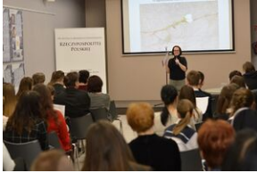
Konkurs recytatorski „W kręgu poezji i prozy lagrowej więźniarek KL Ravensbrück”. Eliminacje wojewódzkie w Kielcach