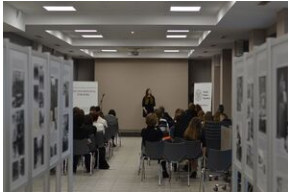
Konkurs recytatorski „W kręgu poezji i prozy lagrowej więźniarek KL Ravensbrück”. Eliminacje wojewódzkie w Kielcach