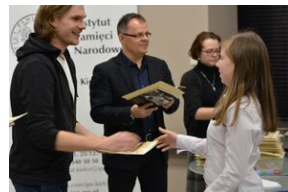
Konkurs recytatorski „W kręgu poezji i prozy lagrowej więźniarek KL Ravensbrück”. Eliminacje wojewódzkie w Kielcach