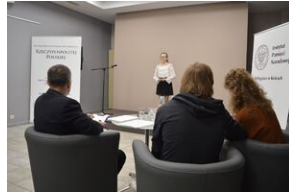
Konkurs recytatorski „W kręgu poezji i prozy lagrowej więźniarek KL Ravensbrück”. Eliminacje wojewódzkie w Kielcach