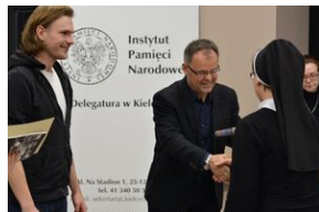
Konkurs recytatorski „W kręgu poezji i prozy lagrowej więźniarek KL Ravensbrück”. Eliminacje wojewódzkie w Kielcach