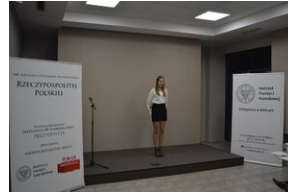
Konkurs recytatorski „W kręgu poezji i prozy lagrowej więźniarek KL Ravensbrück”. Eliminacje wojewódzkie w Kielcach