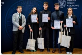
Finał IX Małopolskiego Turnieju Debat Historycznych.