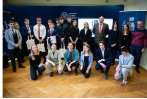
Finał IX Małopolskiego Turnieju Debat Historycznych.