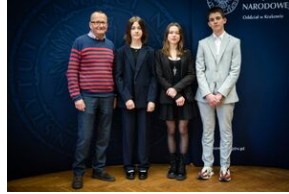
Finał IX Małopolskiego Turnieju Debat Historycznych.