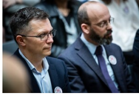
Gala finałowa.