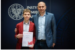
Gala finałowa.