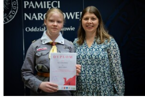
Gala finałowa.