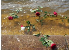
Wyprawa do Niemiec na uroczystości 79. rocznicy oswobodzenia KL Ravensbrück.