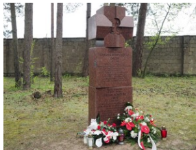
Wyprawa do Niemiec na uroczystości 79. rocznicy oswobodzenia KL Ravensbrück.