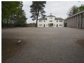
Wyprawa do Niemiec na uroczystości 79. rocznicy oswobodzenia KL Ravensbrück.