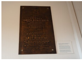
Wyprawa do Niemiec na uroczystości 79. rocznicy oswobodzenia KL Ravensbrück.