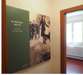
Wyprawa do Niemiec na uroczystości 79. rocznicy oswobodzenia KL Ravensbrück.