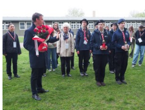
Wyprawa do Niemiec na uroczystości 79. rocznicy oswobodzenia KL Ravensbrück.