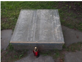
Wyprawa do Niemiec na uroczystości 79. rocznicy oswobodzenia KL Ravensbrück.