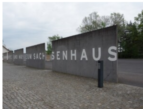
Wyprawa do Niemiec na uroczystości 79. rocznicy oswobodzenia KL Ravensbrück.