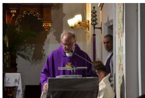
Piotrkowice. Pogrzeb Stefana Rojkowicza.