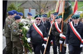
Piotrkowice. Pogrzeb Stefana Rojkowicza.