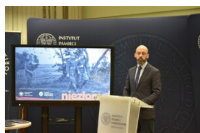
Promocja płyty „Niezwyciężeni”.