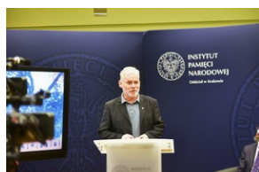
Promocja płyty „Niezwyciężeni”.