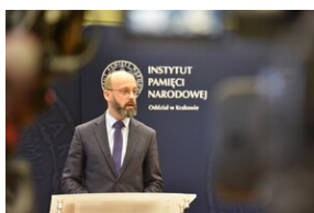
Promocja płyty „Niezwyciężeni”.