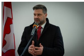
Uroczystość w Barnowcu.