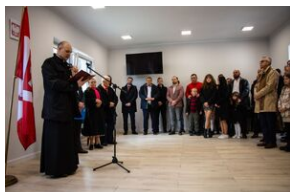
Uroczystość w Barnowcu.