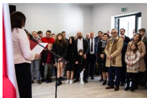
Uroczystość w Barnowcu.