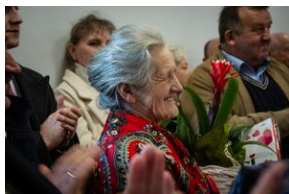
Uroczystość w Barnowcu.