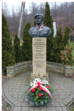
Osielec. Pomnik Zygmunta Szendzielarza „Łupaszki”.