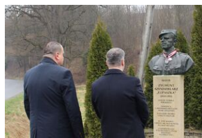
Osielec. Pomnik Zygmunta Szendzielarza „Łupaszki”.