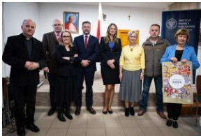
Przystanek Historia Budapeszt. Luty 2024.