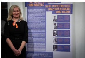
Przystanek Historia Budapeszt. Luty 2024.