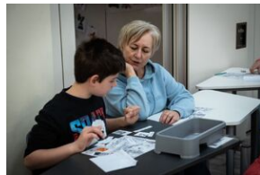
Przystanek Historia Budapeszt. Luty 2024.