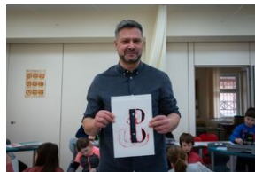
Przystanek Historia Budapeszt. Luty 2024.