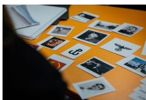
Przystanek Historia Budapeszt. Luty 2024.

Nad Dunaj zawieźliśmy dwie wystawy - o Armii Krajowej (wersja dwujęzyczna - polska i węgierska) oraz Polskim Państwem Podziemnym. My wróciliśmy już do Krakowa, ale wystawy pozostały w Budapeszcie i będą tam prezentowane w najbliższych tygodniach.