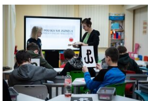
Przystanek Historia Budapeszt. Luty 2024.