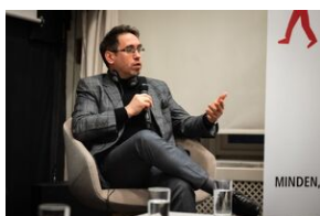
Przystanek Historia Budapeszt. Luty 2024.