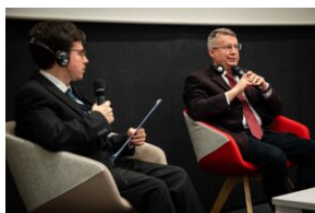
Przystanek Historia Budapeszt. Luty 2024.