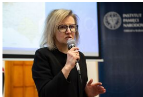
Przystanek Historia Budapeszt. Luty 2024.