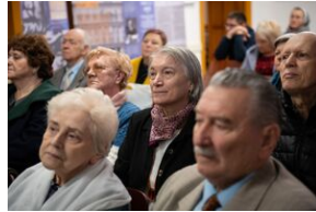
Przystanek Historia Budapeszt. Luty 2024.