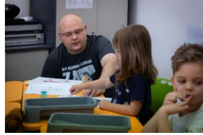
Przystanek Historia Budapeszt. Luty 2024.