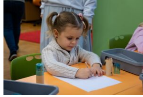
Przystanek Historia Budapeszt. Luty 2024.