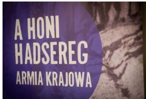
Przystanek Historia Budapeszt. Luty 2024.