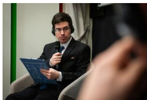
Przystanek Historia Budapeszt. Luty 2024.