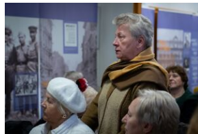
Przystanek Historia Budapeszt. Luty 2024.