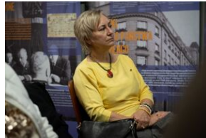
Przystanek Historia Budapeszt. Luty 2024.