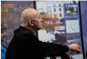
Przystanek Historia Budapeszt. Luty 2024.