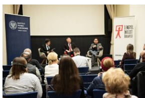
Przystanek Historia Budapeszt. Luty 2024.