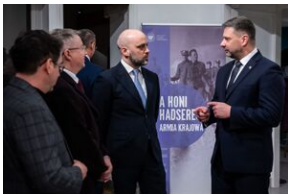
Przystanek Historia Budapeszt. Luty 2024.