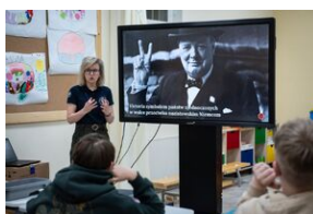
Przystanek Historia Budapeszt. Luty 2024.