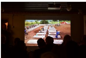
Uroczystości w 84. rocznicę pierwszej masowej deportacji obywateli polskich w głąb ZSRS.