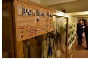
Uroczystości w 84. rocznicę pierwszej masowej deportacji obywateli polskich w głąb ZSRS.