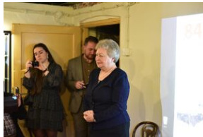
Uroczystości w 84. rocznicę pierwszej masowej deportacji obywateli polskich w głąb ZSRS.