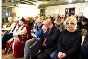
Uroczystości w 84. rocznicę pierwszej masowej deportacji obywateli polskich w głąb ZSRS.