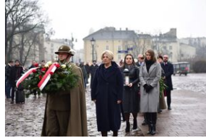
Uroczystości w 84. rocznicę pierwszej masowej deportacji obywateli polskich w głąb ZSRS.