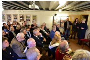
Uroczystości w 84. rocznicę pierwszej masowej deportacji obywateli polskich w głąb ZSRS.