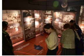
Uroczystości w 84. rocznicę pierwszej masowej deportacji obywateli polskich w głąb ZSRS.