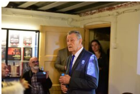
Uroczystości w 84. rocznicę pierwszej masowej deportacji obywateli polskich w głąb ZSRS.