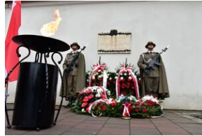
Uroczystości w 84. rocznicę pierwszej masowej deportacji obywateli polskich w głąb ZSRS.