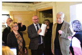
Uroczystości w 84. rocznicę pierwszej masowej deportacji obywateli polskich w głąb ZSRS.