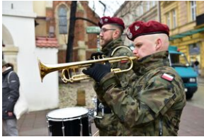
Uroczystości w 84. rocznicę pierwszej masowej deportacji obywateli polskich w głąb ZSRS.