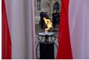
Uroczystości w 84. rocznicę pierwszej masowej deportacji obywateli polskich w głąb ZSRS.