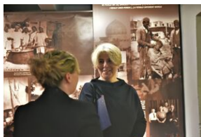
Uroczystości w 84. rocznicę pierwszej masowej deportacji obywateli polskich w głąb ZSRS.