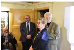
Uroczystości w 84. rocznicę pierwszej masowej deportacji obywateli polskich w głąb ZSRS.