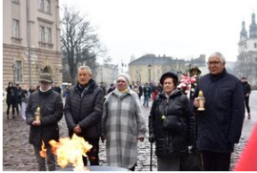
Uroczystości w 84. rocznicę pierwszej masowej deportacji obywateli polskich w głąb ZSRS.