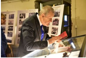
Uroczystości w 84. rocznicę pierwszej masowej deportacji obywateli polskich w głąb ZSRS.