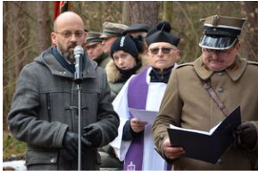
niemieckich egzekucji w Puszczy Nieporomickiej.