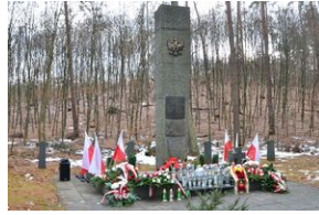
Pomnik ofiar niemieckich egzekucji w Puszczy Niepołomickiej.