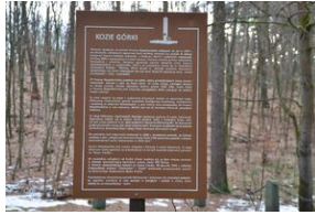
Kozie Górki w Puszczy Niepołomickiej.