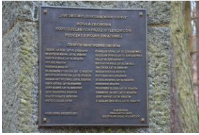
Pomnik ofiar niemieckich egzekucji w Puszczy Niepołomickiej.