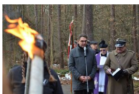
Uroczystość poświęcona ofiarom