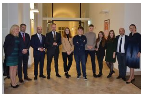
Debata o polityce historycznej.

W tym czasie podopieczni Szkoły Polskiej im. Sándora Petőfiego przy ambasadzie RP obejrzeni spektakl „Historia Misia Wojtka”, opracowany przez Biuro Przystanków Historia IPN. Przedstawienie przybliży najmłodszym losy niedźwiedzia Wojtka – żołnierza 2. Korpusu Polskiego gen. Władysława Andersa.