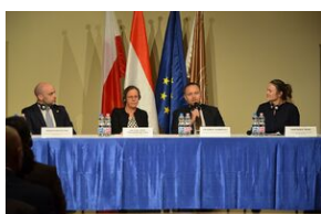
Debata o polityce historycznej.