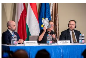
Debata o polityce historycznej.