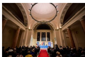
Debata o polityce historycznej.