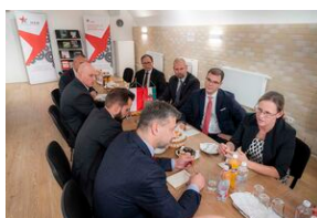
Spotkanie delegacji IPN z kierownictwem NEB.