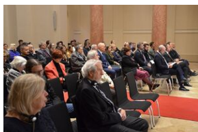
Debata o polityce historycznej.