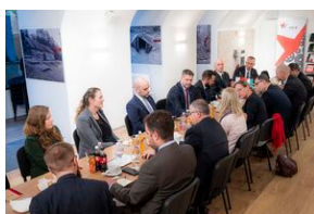
Spotkanie delegacji IPN z kierownictwem NEB.