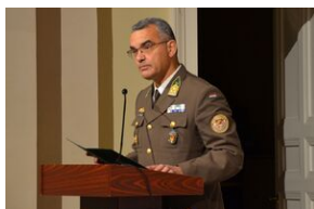
Debata o polityce historycznej.