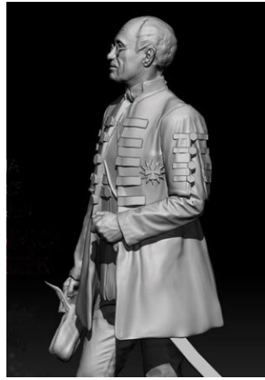
Pomnik Pála Telekiego w Krakowie