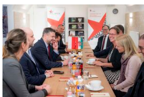
Spotkanie delegacji IPN z kierownictwem NEB.

Delegacja IPN spotkała się ponadto z kierownictwem NEB w siedzibie węgierskiego Komitetu Pamięci Narodowej.