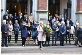
84. rocznica Songeraktion Krakau.