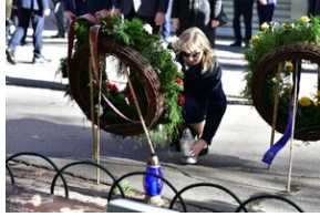
84. rocznica Songeraktion Krakau.