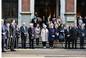
84. rocznica Songeraktion Krakau.