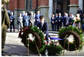
84. rocznica Songeraktion Krakau.