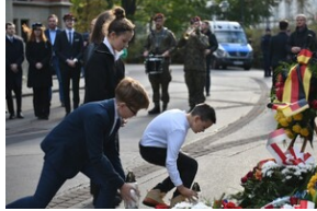
84. rocznica Songeraktion Krakau.