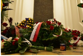
84. rocznica Songeraktion Krakau.