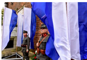
Uroczystość z okazji 105. rocznicy wyzwolenia Krakowa z rąk austriackich.