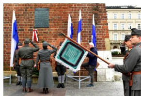
Uroczystość z okazji 105. rocznicy wyzwolenia Krakowa z rąk austriackich.