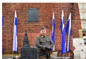
Uroczystość z okazji 105. rocznicy wyzwolenia Krakowa z rąk austriackich.