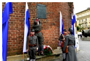
Uroczystość z okazji 105. rocznicy wyzwolenia Krakowa z rąk austriackich.