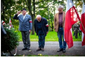
Uroczystości w 60. rocznicę śmierci Józefa Franczaka „Lalusia”.