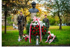
Uroczystości w 60. rocznicę śmierci Józefa Franczaka „Lalusia”.