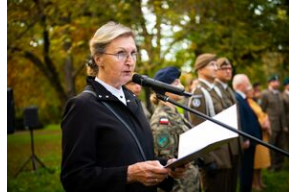
Uroczystości w 60. rocznicę śmierci Józefa Franczaka „Lalusia”.