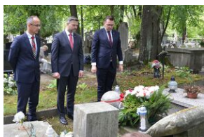
Znicze pamięci na grobie Mieczysława Ślabeo na cmentarzu Rakowickim.

Od sierpnia 1939 r. był lekarzem w Wojskowej Składnicy Tranzytowej na Westerplatte. Opiekował się rannymi w czasie obrony półwyspu. Następnie został, mimo posiadania stopnia oficerskiego, umieszczony w stalagu. Po zakończeniu wojny jako lekarz został przydzielony do ambulatorium VIII Oddziału Wojsk Ochrony Pogranicza w Przemyślu. W listopadzie 1947 r. aresztowany przez Urząd Bezpieczeństwa. W wyniku brutalnego śledztwa zmarł w więzieniu na Montelupich w Krakowie 15 marca 1948 r. Pochowany potajemnie na cmentarzu wojskowym przy ul. Prandoty w Krakowie.