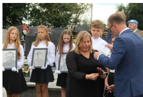
Znicze na grobie Jana Stradomskiego