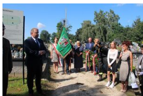
Znicze na grobie Franciszka Łojka