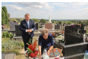
Znicze na grobie Józefa Michalika