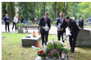
Znicze pamięci na grobie Franciszka Dąbrowskiego na cmentarzu Rakowickim.