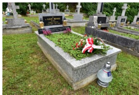
Grób ks. Leona Bemkego.