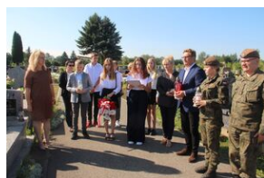
Znicz na grobie Bronisława Drobka