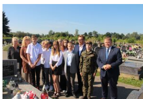
Znicz na grobie Bronisława Drobka