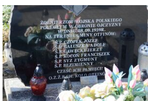
Cmentarz w Otfinowie.