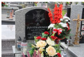
Znicze na grobie Jana Stradomskiego