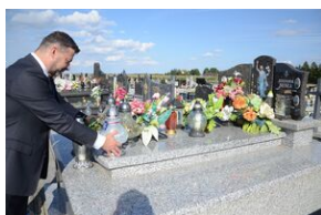
Cmentarz w Otfinowie.

Urodził się w 1915 r. w Siedliszowicach. W latach 1938-1939 został powołany do wojska. Służył w II Batalionie Morskim w Gdyni, a od czerwca 1939 r. w Wojskowej Składnicy Tranzytowej na Westerplatte. W czasie obrony półwyspu został ranny. Następnie przebywał w stalagu, skąd został wysłany na roboty przymusowe. Po wojnie zamieszkał w Bielawie na Dolnym Śląsku. Tam pracował fizycznie aż do przejścia na emeryturę w 1975 r. Zmarł dwadzieścia lat później. Został pochowany w rodzinnych stronach, na cmentarzu parafialnym w Otfinowie.