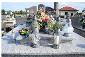
Cmentarz w Otfinowie.