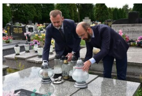
Znicze na grobach westerplaczków - Oświęcim.