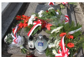
Znicze na grobie Stefana Gajdy