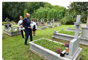
Grób ks. Leona Bemkego.