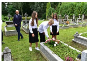
Grób ks. Leona Bemkego.