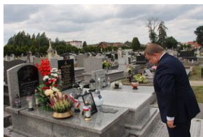
Znicze na grobie Jana Stradomskiego