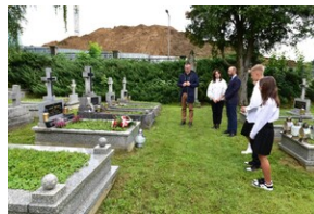
Grób ks. Leona Bemkego.