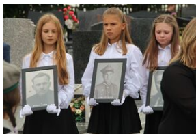
Znicze na grobie Jana Stradomskiego