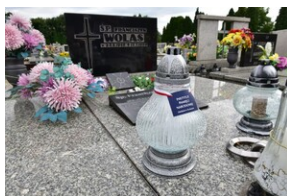
Znicze na grobach westerplaczków - Oświęcim.