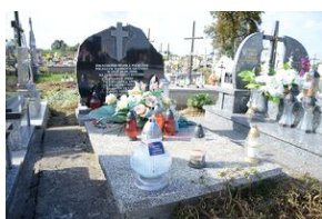
Cmentarz w Otfinowie.