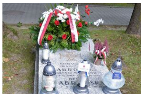
Znicze pamięci na grobie Franciszka Dąbrowskiego na cmentarzu Rakowickim.