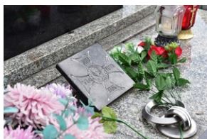
Znicze na grobach westerplaczków - Oświęcim.

Urodził się w 1916 r. w Gierałtowicach koło Wadowic. W latach 1938-1939 odbywał służbę wojskową m.in. na Westerplatte. Brał udział w obronie półwyspu. Po kapitulacji został osadzony w obozie dla jeńców wojennych, a stamtąd wysłany w 1940 r. na roboty przymusowe do Ławy w Prusach Wschodnich. Od 1946 r. pracował jako ślusarz w Zakładach Chemicznych w Oświęcimiu. Od 1976 r. był na emeryturze. Zmarł w 1989 r.