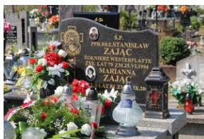
Znicz na grobie Stanisława Zajęca