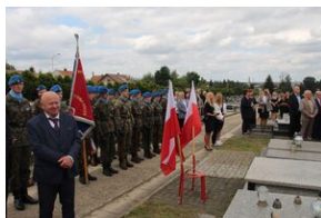
Znicze na grobie Jana Stradomskiego