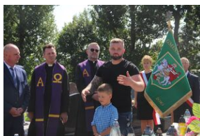
Znicz na grobie Stanisława Zajęca