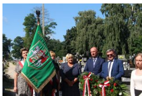
Znicze na grobie Franciszka Łojka