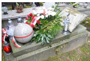
Znicze pamięci na grobie Mieczysława Ślabeo na cmentarzu Rakowickim.