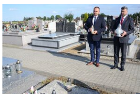
Cmentarz w Otfinowie.