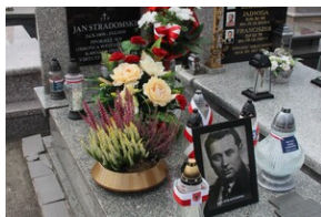
Znicze na grobie Jana Stradomskiego