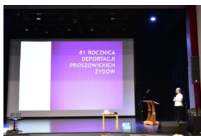
81. rocznica deportacji proszowickich Żydów.