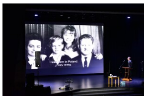
81. rocznica deportacji proszowickich Żydów.