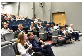
81. rocznica deportacji proszowickich Żydów.