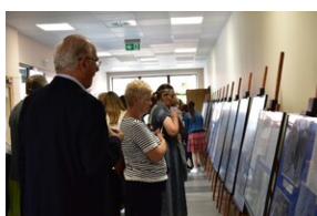
81. rocznica deportacji proszowickich Żydów.