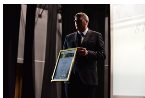
81. rocznica deportacji proszowickich Żydów.