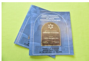
81. rocznica deportacji proszowickich Żydów.