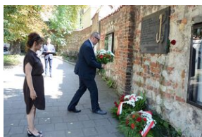
Złożenie kwiatów pod tablicą upamiętniającą rozbiście więzienia św. Michała w Krakowie.