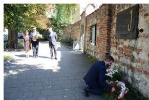
Złożenie kwiatów pod tablicą upamiętniającą rozbiście więzienia św. Michała w Krakowie.