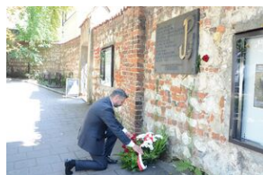
Złożenie kwiatów pod tablicą upamiętniającą rozbiście więzienia św. Michała w Krakowie.

tablicą upamiętniającą rozbiście więzienia św. Michała, która znajduje się na ul. Poselskiej. Dawne więzienne budynki zajmuje obecnie Muzeum Archeologiczne.