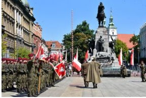
Święto Wojska Polskiego w Krakowie.