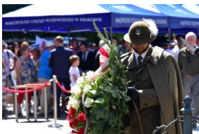
Święto Wojska Polskiego w Krakowie.