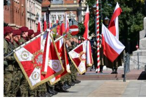
Święto Wojska Polskiego w Krakowie.