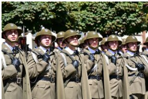
Święto Wojska Polskiego w Krakowie.