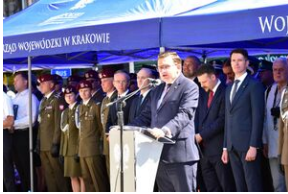
Święto Wojska Polskiego w Krakowie.