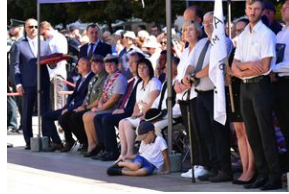
Święto Wojska Polskiego w Krakowie.