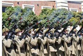
Święto Wojska Polskiego w Krakowie.