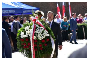
Święto Wojska Polskiego w Krakowie.