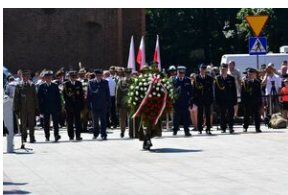
Święto Wojska Polskiego w Krakowie.