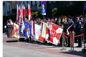
Święto Wojska Polskiego w Krakowie.