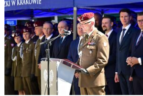
Święto Wojska Polskiego w Krakowie.