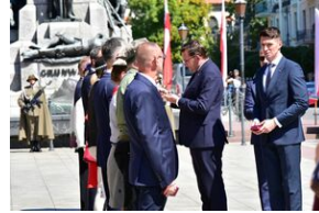
Święto Wojska Polskiego w Krakowie.