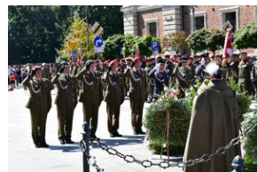
Święto Wojska Polskiego w Krakowie.