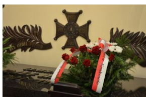
150. rocznica urodzin gen. Józefa Hallera.