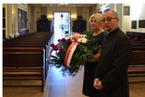
150. rocznica urodzin gen. Józefa Hallera.