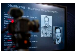
Ogólnopolska konferencja naukowa