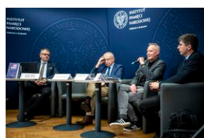
Ogólnopolska konferencja naukowa