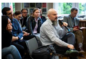
Ogólnopolska konferencja naukowa „Za kulisami bezpieczeństwa...”.