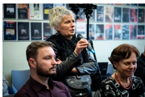
Ogólnopolska konferencja naukowa „Za kulisami bezpieki...”.