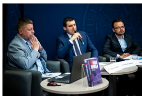
Ogólnopolska konferencja naukowa „Za kulisami bezpieki...”.