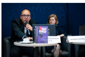
Ogólnopolska konferencja naukowa „Za kulisami bezpieczeństwa...”.