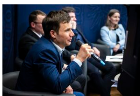
Ogólnopolska konferencja naukowa „Za kulisami bezpieczeństwa...”.