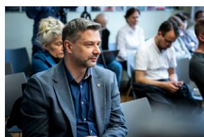
Ogólnopolska konferencja naukowa „Za kulisami bezpieczeństwa...”.