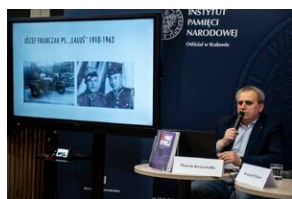
Ogólnopolska konferencja naukowa „Za kulisami bezpieczeństwa...”.