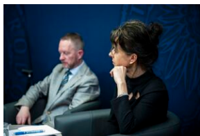
Ogólnopolska konferencja naukowa „Za kulisami bezpieczeństwa...”.