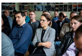
Ogólnopolska konferencja naukowa „Za kulisami bezpieczeństwa...”.