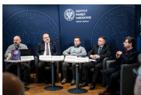
Ogólnopolska konferencja naukowa „Za kulisami bezpieczeństwa...”.