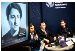
Ogólnopolska konferencja naukowa „Za kulisami bezpieczeństwa...”.