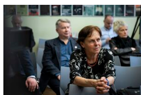
Ogólnopolska konferencja naukowa „Za kulisami bezpieczeństwa...”.