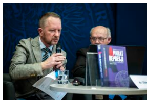
Ogólnopolska konferencja naukowa „Za kulisami bezpieczeństwa...”.