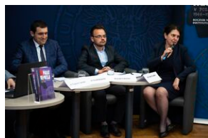
Ogólnopolska konferencja naukowa „Za kulisami bezpieki...”.