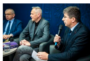
Ogólnopolska konferencja naukowa