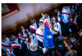
Uroczystości pogrzebowe Jana Sałapatka „Orla”.